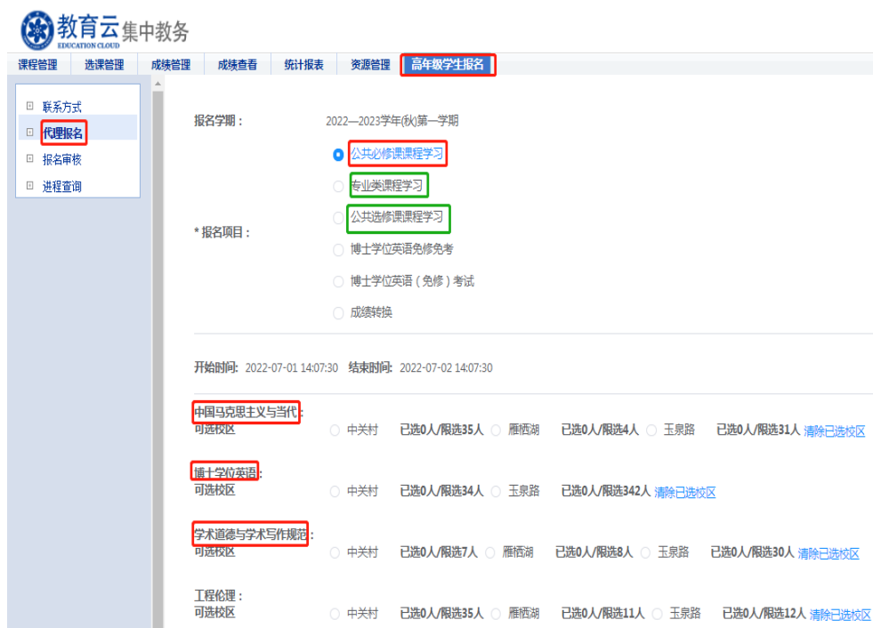
图 5 教育干部代理报名界面