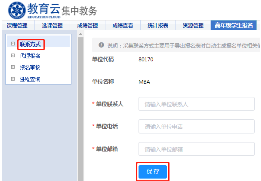
图6 联系方式填写界面

第二步：“集中教务” — “高年级学生报名” — “报名审核”，进入“报名审核”页面，在“项目类型”处分别选择“公共必修课课程学习”、“专业类课程学习”、“公共选修课课程学习”，在符合报名条件的学生信息右侧操作区点击审核“通过”或“不通过”，即完成资格审核，报名审核界面见图7。