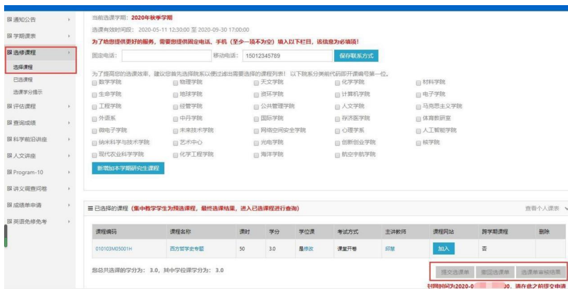
图 8 选课界面

选课网址 http://sep.ucas.ac.cn/ 。首次登录系统时，用户名为学号，密码为身份证号（字母需大写）。登录后进入“选课系统”的“选修课程”模块选择课程，填写并保存联系方式后才可选择开课学院的相关课程，选课界面见图 8。