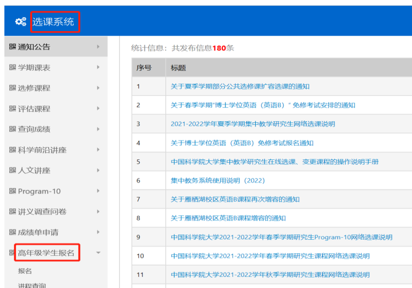
图 1 选课系统界面

第二步，进入“高年级学生报名”模块点击“报名”，在“报名项目”处根据自身需要点击“公共必修课课程学习”、