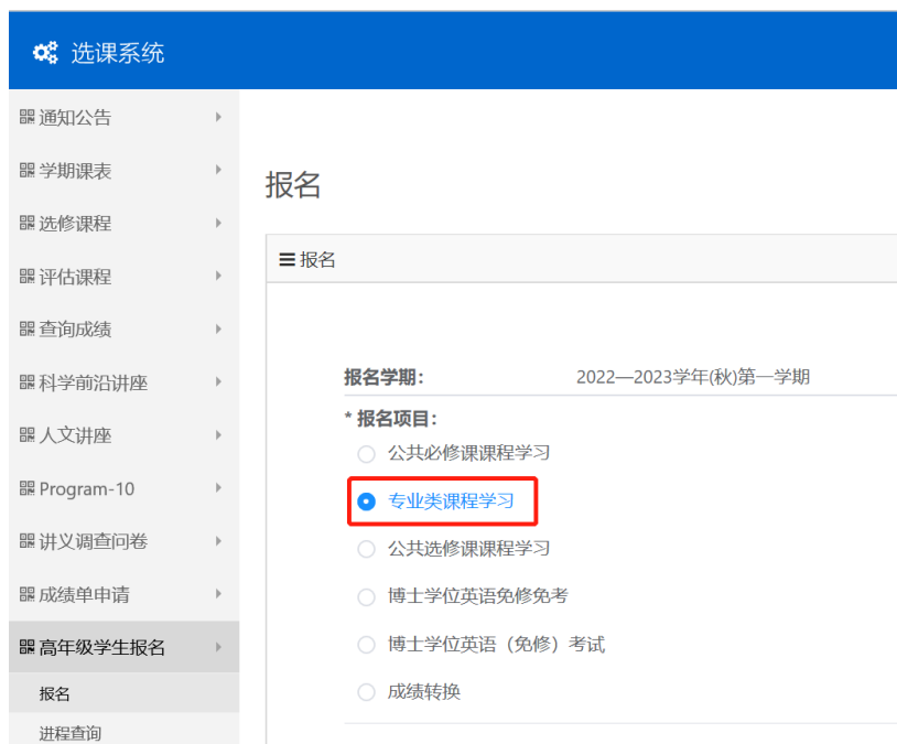
图 4 “专业类课程” 报名界面 (“专业类课程” 为例)