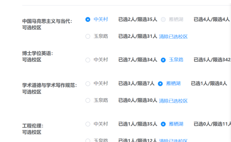
图 3 “公共必修课”课程报名

第三步，学生报名“公共必修课课程学习”项目时，须点击课程对应的校区，单击“点击报名”，即完成报名，见图 3。